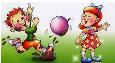
sucio - limpio