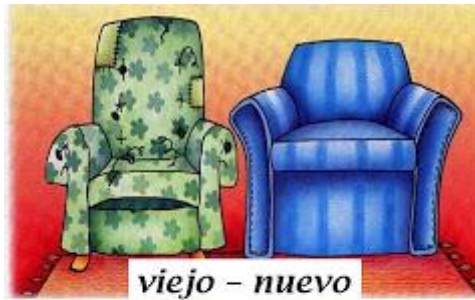
viejo - nuevo