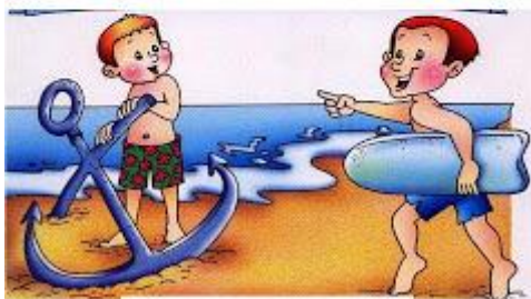
pesado - ligero