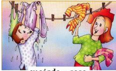
mojado - seco