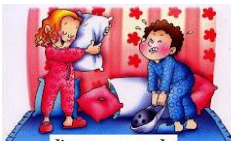
ligero - pesado