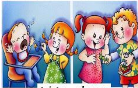
triste - alegre