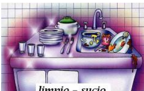
limpio - sucio