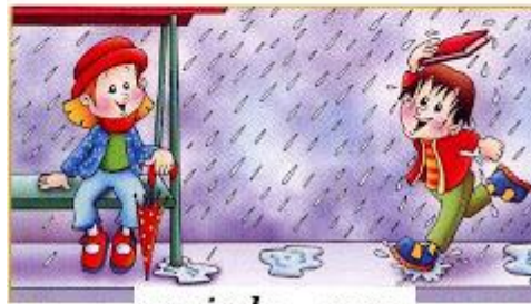
mojado - seco