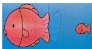
grande - pequeño

Las categorías que trabajamos nosotros fueron: