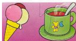
frío - caliente